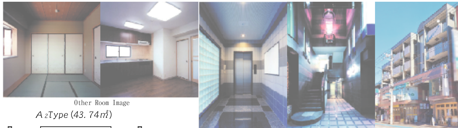
Other Room Image

《仙川駅》徒歩3分の好立地!! 最高の利便性、HighSenseな生活、安心をご堪能下さい