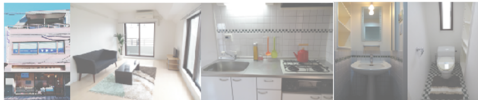
G 1 Type (38.31㎡)